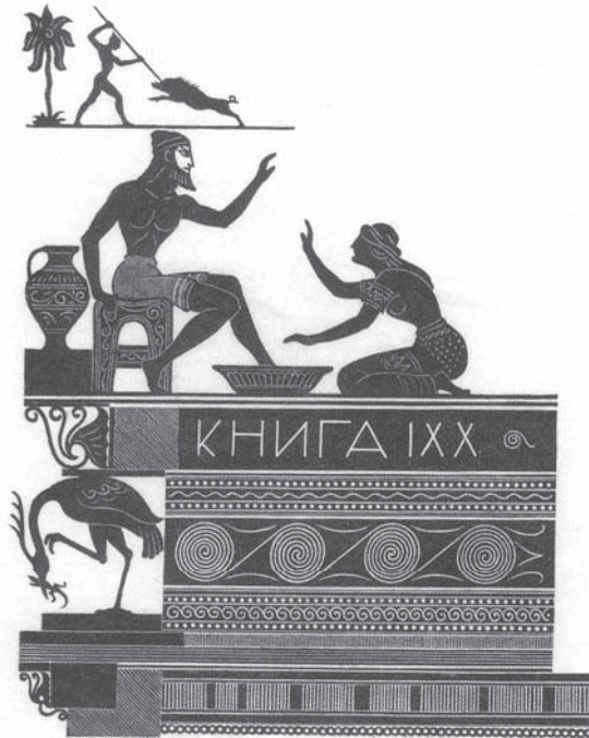
Smuțtitlu din poemul Odiseea de Homer. 1935. Xilogravură pe hârtie

1910). Aceasta reprezintă un model excepțional de compoziție, figurile oamenilor și înfățișările animalelor fiind amplasate în prim-planul lucrării – procedeu aplicat pentru prima oară de către pictor în lucrarea sa de diplomă. Prin intermediul unor hașurări scurte și o prelucrare mai amănunțită a formei, Pavel Șillingovski subliniază contrastul spațial dintre planuri, asigurând perspectiva aeriană a peisajului. Foaia menționată este una dintre primele create în tehnica acvafortei, de unde și concluzia că autorul posedă procedee specifice acestui domeniu. Deocamdată volumul și forma se formează cu ajutorul hașurei și petei tonale, spațiul se redă încă amorf, prin intermediul contrastelor de proporții.