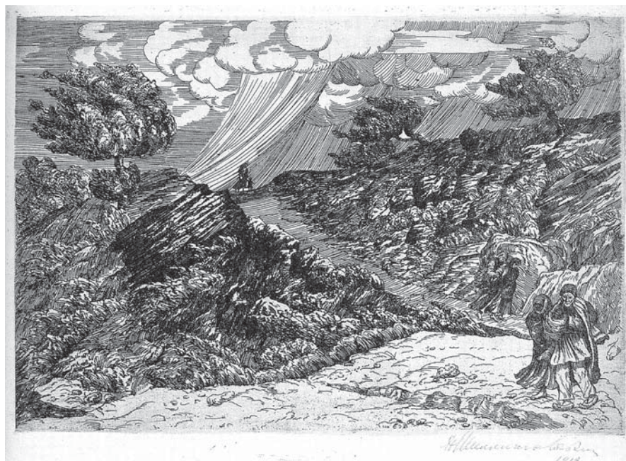
Basarabia. Furtună. 1913. Acvaforte pe hârtie

Deja în primele sale studii basarabene se urmărește atracția pictorului pentru un colorit neobișnuit, direct legat nu doar de redarea unei dispoziții reale a naturii, ci și de lumea senzațiilor și emoțiilor, în care tensiunea emotivă atinge cota de vârf a expresivității. Asemenea calități denotă în primul rând lucrarea de diplomă a maestrului – „Basarabia. Ghicitul” (1911). Exoticul motivului este complimentat de o compoziție și un colorit cizelate până la desăvârșire. Pământul alb de lumina și arșița soarelui ne deplasează imaginar în pustii îndepărtate. Figurile seminude ale țăranilor și a țigăncii, aflându-se în umbră, par a fi transparente în lumina solară. Umbra de un albastru deschis cu nuanțe cafenii, abia vizibilă, accentuează și mai mult această impresie. Dinamismul gesturilor, privirilor sugerează un dialog intens dintre personaje. Iar deasupra tuturor plutește doar arșița și liniștea, subliniind atmosfera de ritual și magie.