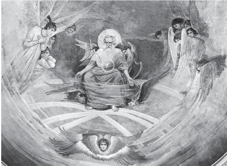
Dumnezeu Tatăl își așteaptă Fiul. 1907. Ulei, tempera

Apropiate ca structură ciclului de acvaforte sunt și crochiurile pictorului – „Nistru”, „Basarabia. Peisaj cu dealuri”, „Basarabia. Dealuri pe mal”, „Basarabia. Valea Nistrului” (toate datând cu anii 1910) etc., prin selectarea riguroasă a elementelor peisajului, viziunea epică și panoramică, contrastele comparative.