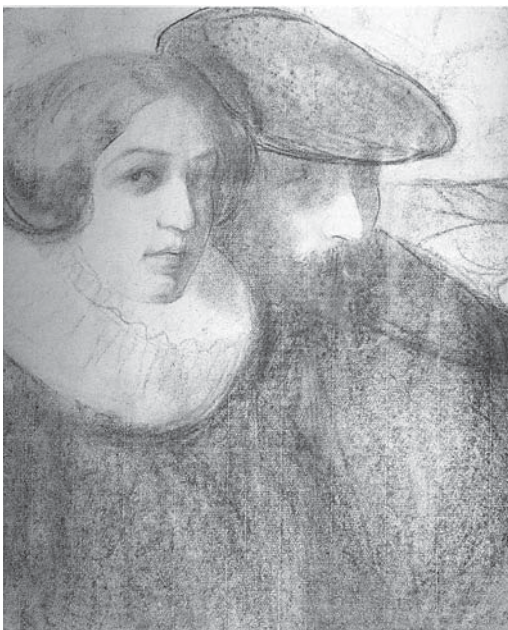
Autoportret cu soția 1914. Sanguină pe hârtie

Printre pictorii basarabeni din perioada interbelică un nume de referință a fost cel al lui Pavel Șillingovski. Figură remarcabilă, a ilustrat prin creațiile sale cele mai valoroase tradiții ale artei europene, chiar și în perioada când aceste tendințe nu mai erau tolerate. La un secol de la