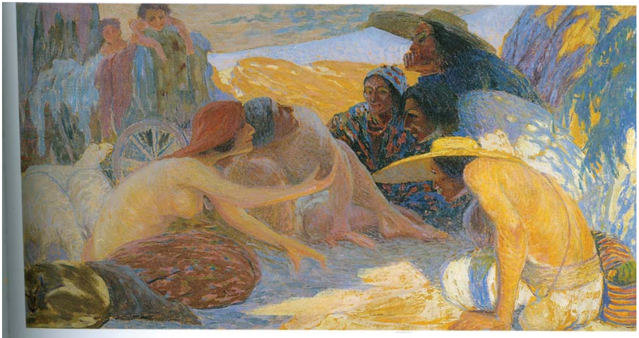
Basarabia. Ghicitul. 1911. Ulei pe pânză

Motivele peisajelor grafice repetă subiectele din pictură. Caracteristic pentru foile grafice este perseverența autorului de a crea dispoziția ambianței. Ca și în tablouri, dominantă principală este măreția naturii, aflată în diverse ipostaze