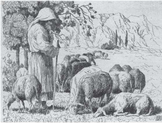
Basarabia. Oi. 1912. Acvaforte pe hârtie

Dimensiunile considerabile ale pânzei, mișcarea compozițională a căreia se desfășoară pe diagonală, accentuează monumentalismul proporțiilor.