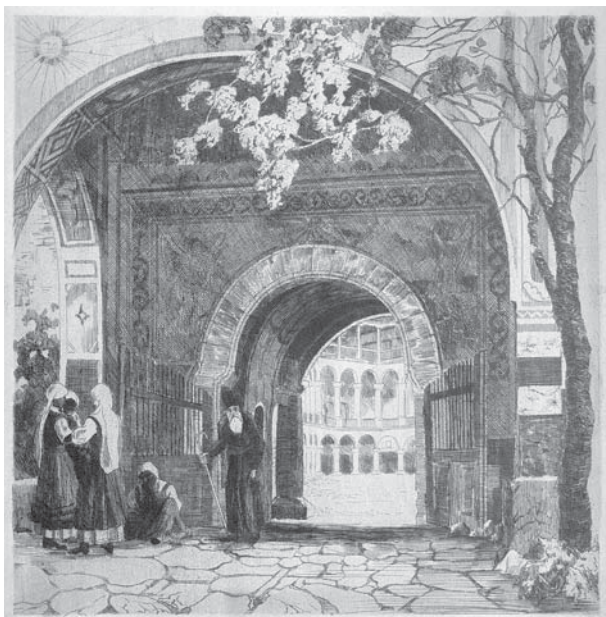
Mănăstiri din Bulgaria. 1913. Acvaforte pe hârtie

Printre primele lucrări grafice ale ciclului basarabean se numără stampa „Basarabia.Oi” (anii