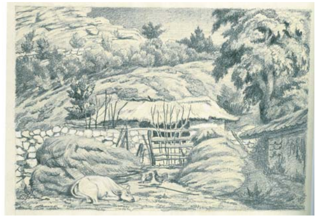
Curte țărăneasă. [?] Creion pe hârtie

Profunzimea emoțiilor și trăirilor în subiectele selectate, coloritul impresionist ce incită dispoziția