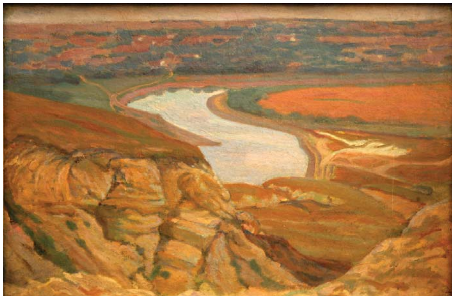
Basarabia. Nistru. 1910. Ulei pe pânză lipită pe carton

Decedat la 5 aprilie 1942, în Leningradul asediat, Pavel Șillingovski a însemnat foarte mult pentru arta basarabeană. A fost printre puținii filantropi care a donat colecția sa Chișinăului. Constituită din circa 200 de gravuri ale vechilor maeștri europeni și ruși din secolele XVII-XVIII și cuprinzând integral operele personale de pictură și grafică, aceste colecții reprezintă cele mai importante fonduri de artă modernă ale actualului Muzeu Național de Artă.